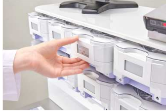
ロックが解除される